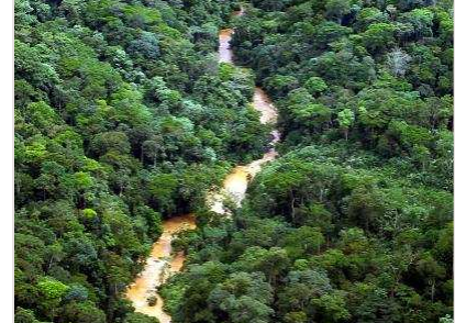
Raubbau an Afrikas Urwäldern

Prozentual am meisten zerfurcht sind dieser Auswertung nach die tropischen Wälder von Kamerun und Äquatorialguinea. Am schnellsten aber veränderte die Holzindustrie das Urwaldgebiet im Norden der Republik Kongo (Brazzaville), wo das Straßennetz durch Kahlschlag innerhalb eines Jahrzehnts um das Vierfache wuchs.